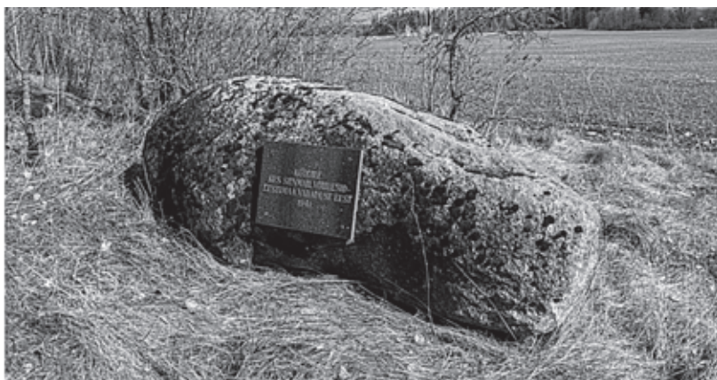
Mälestuskivi avati 3. augustil 1996 aastal.