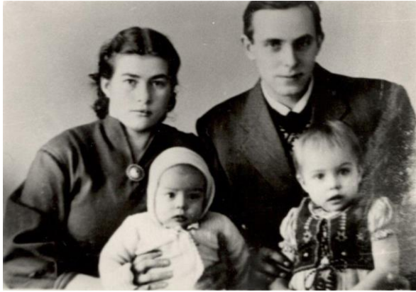
Viimane pilt Kirovis enne tagasitulekut Eestisse 1959